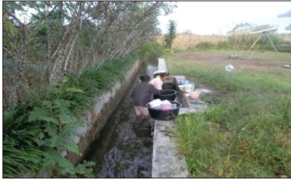
Gambar 3. Pemanfaatan Air yang Berasal dari TWA Sicike-Cike

Menurut data dari Balai Besar Konservasi Sumber Daya Alam (BBKSDA) Sumatra Utara, TWA Sicike-Cike memiliki danau, dua hulu sungai besar (Lae Pandaroh dan Lae Prada), dan lima anak sungai (2 bermuara ke Sungai Lae Prada dan tiga bermuara ke Sungai Lae Pandaroh). 7 Pemberian nama desa di sekitar TWA