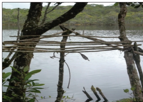
Gambar 2. Para-Para Tempat Menyajikan Sesajen

Sebagaimana halnya tempat-tempat keramat pada umumnya, TWA Sicike-Cike juga diyakini memiliki kekuatan magis sehingga wajar apabila peziarah menunjukkan rasa hormat pada hutan melalui sikap hati-hati dalam bertindak di dalam kawasan serta memberikan sesaji (sesajen) berupa telur ayam kampung, ayam putih, sirih, “sumpit” (semacam tempat nasi), kelapa muda, dan sejenis makanan tradisional yang disebut “cimpa”. Semuanya diletakkan di atas para-para sebagai persembahan kepada leluhur mereka. Para-para tersebut biasanya didirikan di tepian Danau Sicike-Cike yang terdapat dalam wilayah TWA tersebut (Gambar 2). Saat pulang, para peziarah membawa air danau. Menurut keyakinan mereka, dengan meminum air dan memercikkan air tersebut ke rumah maka penyakit-penyakit seperti sakit perut, sakit jiwa, dan kerasukan makhluk gaib akan hilang. Kegiatan berziarah bahkan dilakukan oleh masyarakat anak suku Batak Pakpak yang tinggal jauh dari TWA Sicike-Cike.