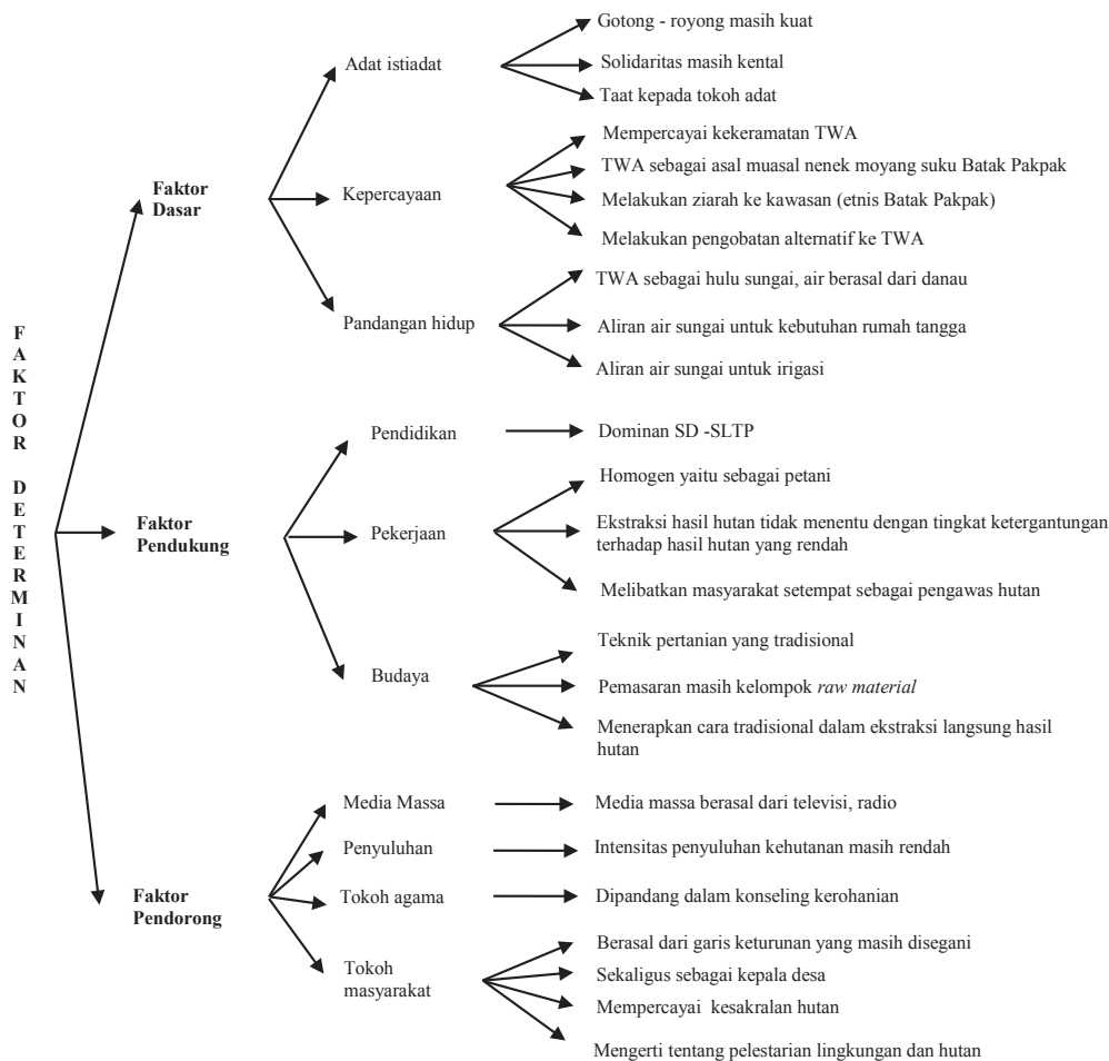
Gambar 4. Taksonomi Faktor Determinan yang Memengaruhi Kearifan Lokal

Kepatuhan kepada tokoh-tokoh adat atau masyarakat merupakan kearifan lokal yang juga masih terpelihara di Desa Lae Hole. Sejarah menunjukkan bahwa Desa Lae Hole didominasi oleh keturunan marga Sihombing yang dikenal dengan sebutan Toke Mateus yang merupakan keturunan Ompung Sipuaga. Pada saat penelitian ini dilakukan, yang tengah menjabat sebagai kepala desa berasal dari keturunan Ompung Sipuaga. Dengan demikian, kepala desa tersebut juga sekaligus merangkap sebagai tokoh adat masyarakat setempat yang dipandang masih memahami hubungan penduduk dengan hutan Sicike-Cike.